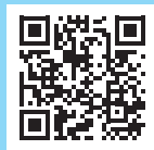
FORMULARIO DE INSCRIPCIÓN