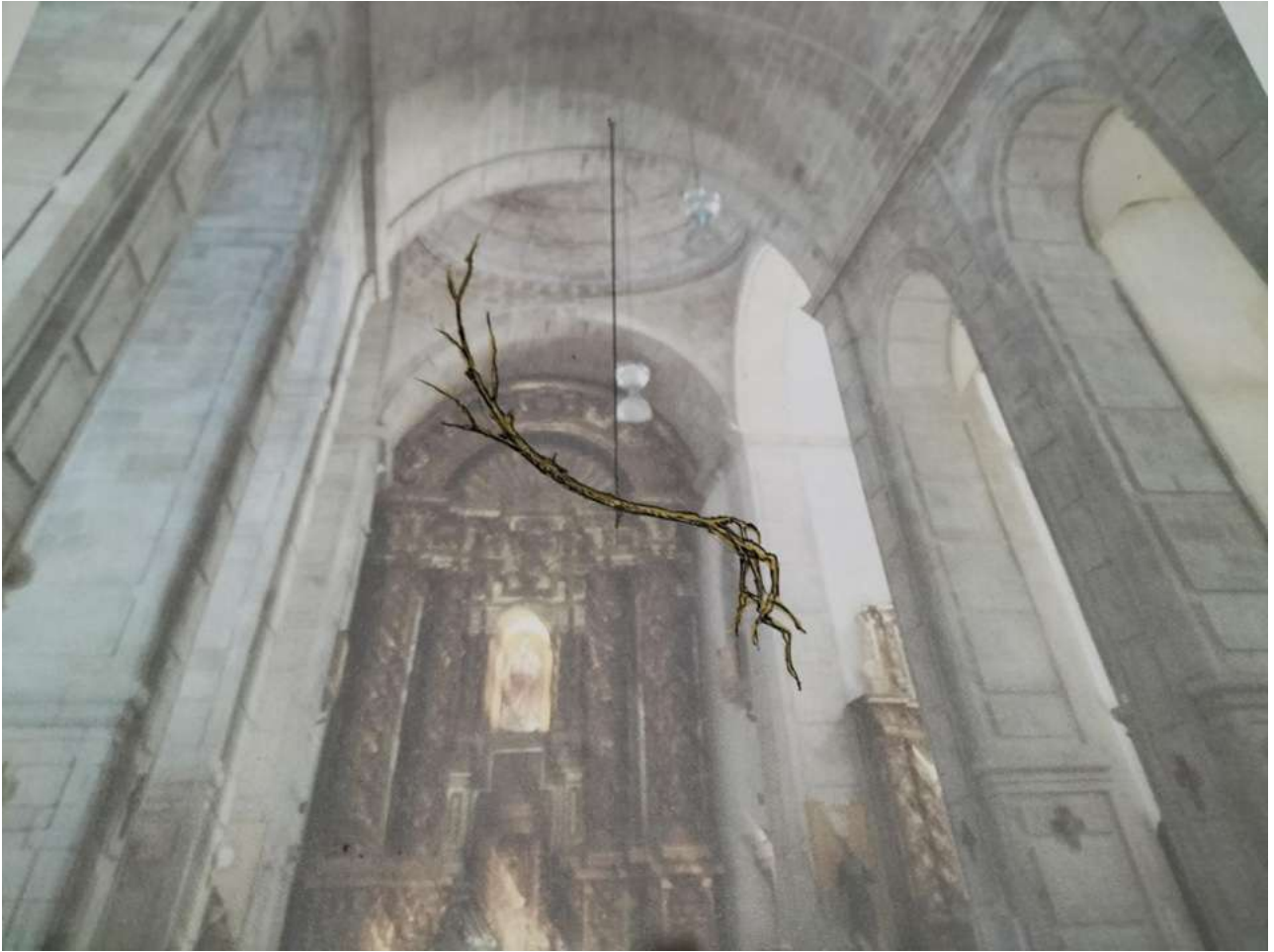
Simulaciones del diseño expositivo en claustro e iglesia